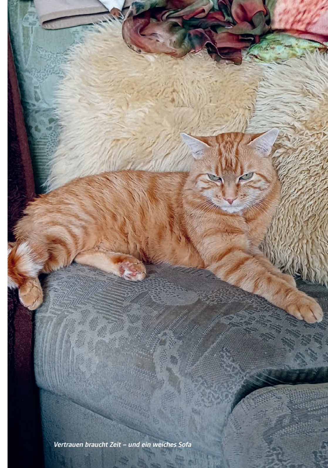
Vertrauen braucht Zeit – und ein weiches Sofa